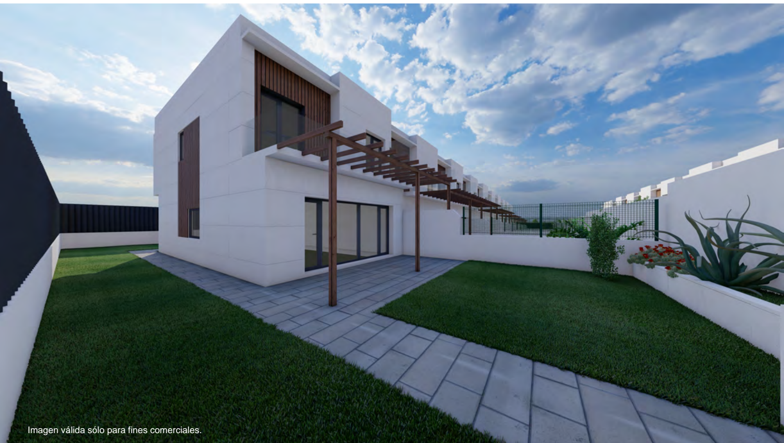
Imagen válida sólo para fines comerciales.