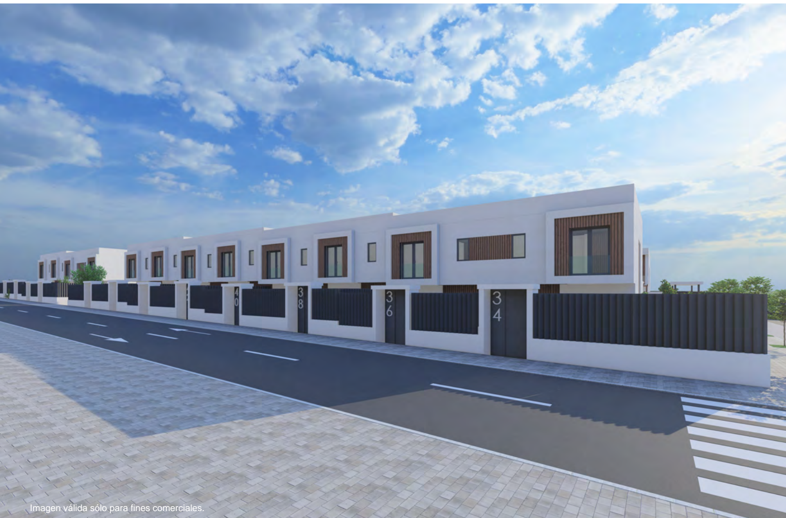
Imagen válida sólo para fines comerciales.